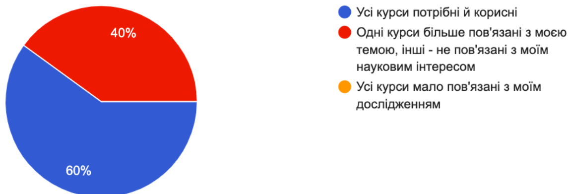
Рис. 4. Наскільки Ви задоволені вибірковыми компонентами?